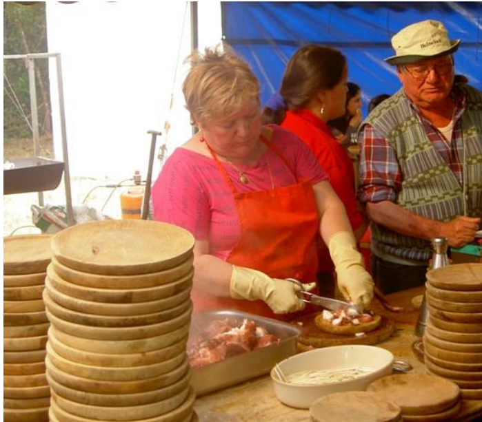
PULPEIRA (TERRIO) (GOIRIZ)