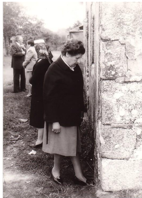
RITUAL O “OCO NO CHÁN” (CARBALLIDO)

A festividade neste santuario celebrábase o domingo da Ascensión. Acodían devotos do concello de Begonte e doutros concellos da Terra Chá, como Guitiriz, Outeiro de Rei, Vilalba, e de Lugo capital. 18 Éstes veñen a pregar ó santo ou darlle as grazas por pedimentos ligados con dores de cabeza e das extremidades inferiores, bocio, vultos, e algo por doenzas de animais, como, cochos e vacas. Isto leválles a realizar unha serie de promesas: Así, oen a misa solemne da unha da tarde. Participan na procesión, acompañando ás