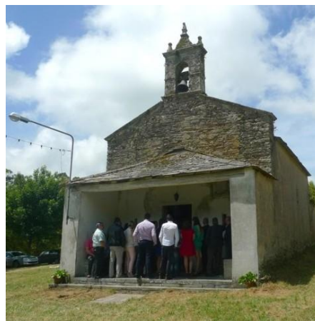
CAPELA DO SAN ADRIÁN (FITOIRO)

En Carballido (Pacios) (Begonte), o domingo seguinte ao xoves da Ascensión.