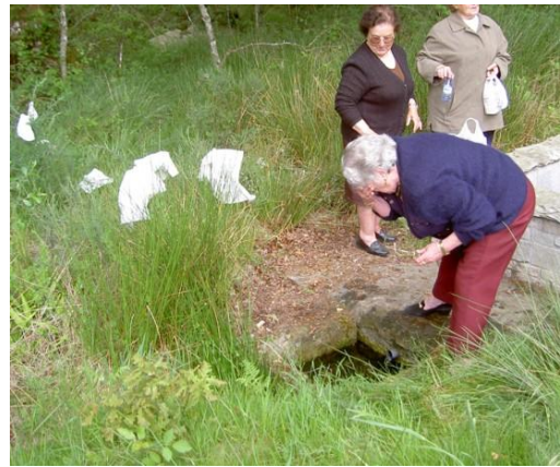
RITUAL DA FONTE (TERRÍO) (GOIRIZ)

Por unha banda, algúns devotos lavan cuns panos de mesa e de tea as doenzas ligadas, dun xeito preferente, con garganta, osos e pel, e logo deixanos pendurando por riba dunhas silvas. Tamén adoitan levar botellas de auga para as propias casas coa finalidade de poder continuar co ritual. Ademais había o costume de pedir por si mesmo e por algúns familiares botando miolos de pan na fonte, mentres ían nomeándoos un