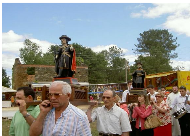
RITUAL DA PROCESIÓN (CARBALLIDO) (PACIOS)

O territorio de gracia destes santuarios non é homoxeneo. Iste feito queda reflectido en que a afluencia de devotos aos santuarios de Carballido (Pacios) e Fitoiro (Bretoña) diminuiu nos últimos anos, debido, entre outras razóns, a que só se celebra unha misa a comezos da tarde. Pola contra, vinte anos que xurdiu a “Asociación de romeiros do S. Adrián de Goiriz”