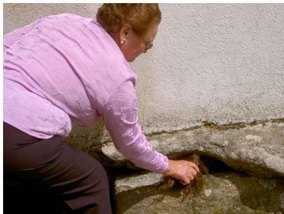
RITUAL DO SARTEGO (TERRÍO) (GOIRIZ)