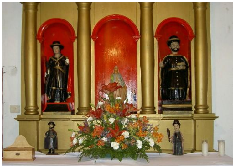
RETABLO DA CAPELA DO SAN ADRIÁN ( CARBALLIDO) (PACIOS)