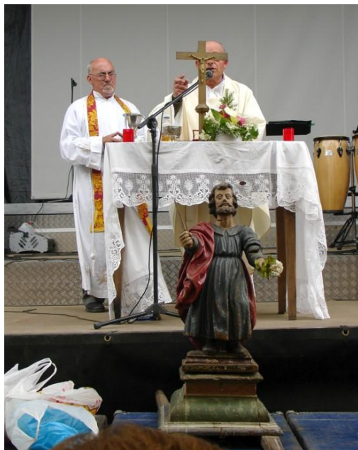
MISA CONCELEBRADA NA HONRA DO SAN ADRIÁN (TERRÍO)