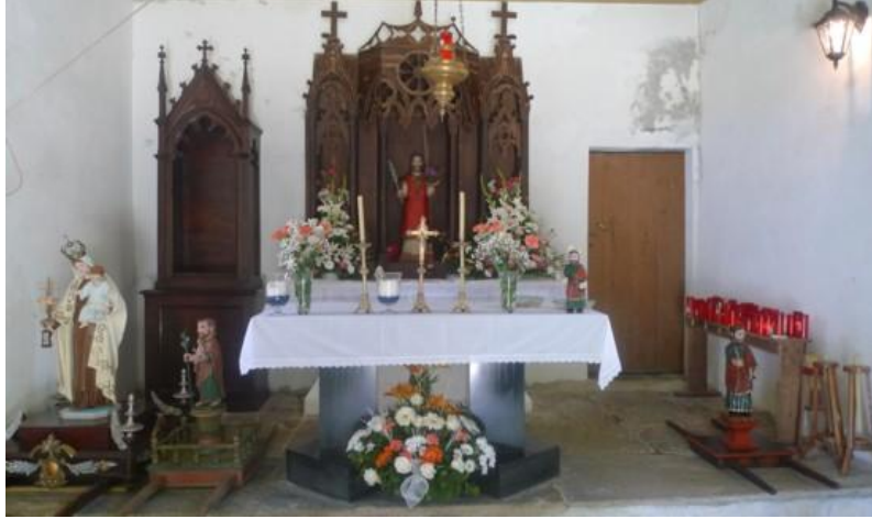
INTERIOR DA CAPELA DO SAN ADRIÁN (FITOIRO) (BRETOÑA)