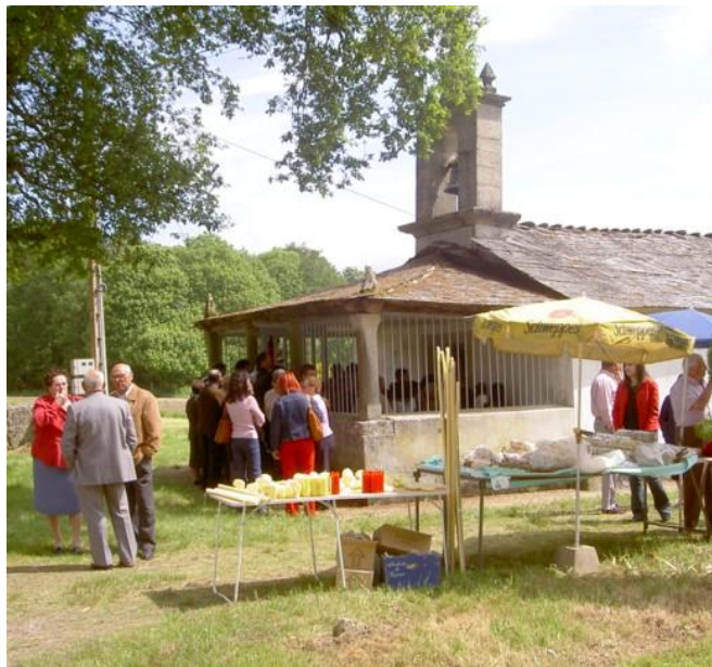
CAPELA DO SAN ADRIÁN (TERRÍO) (GOIRIZ)