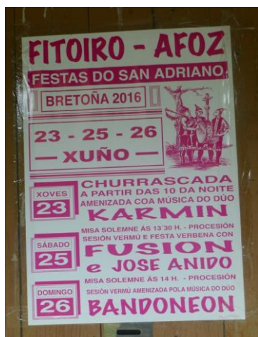
CARTEL ANUNCIADOR DA FESTA.

Con relación a actividade económica podemos facer mención a unha comarca que ten como sostén a actividade agropecuaria, que dá emprego a máis dun terzo da poboación activa; a modernización gandeira maniféstase tanto no alto grao de