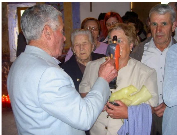
RITUAL DE "POÑER O SANTO" (TERRÍO) (GOIRIZ)