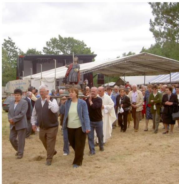
RITUAL PROCESIONAL (TERRÍO) (GOIRIZ)