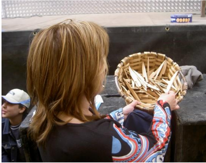
COITELOS DO SAN ADRIÁN (TERRÍO) (GOIRIZ)