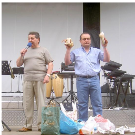
RITUAL DA “POXA” (TERRÍO) (GOIRIZ)

Ademais, realizan dous rituais específicos deste santuario, a saber, o ritual do sartego e o ritual da fonte.