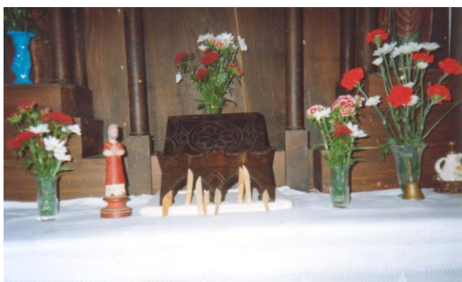
A IMAXE E OS COITELOS DO SAN ADRIÁN POUSADOS NO ALTAR (FITOIRO).

Por outra banda, o crego Xosé Antón Míguez na análise que fai sobre os santuarios distingue os seguintes elementos: a vivencia do social vencellado a uns lugares e obxectos concretos; o predominio da emoción sobre a racionalidade; a cosmovisión estática e non histórica; e o carácter popular pouco institucionalizado 8 .