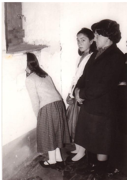
RITUAL DA “VENTÁ CEGA”(CARBALLIDO)

O recinto sagrado constitúe unha construción rústica de pedra, pequena, que posúe unha cuberta a dúas augas. No seu interior hai un pequeno retábulo